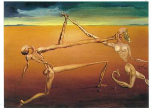
© Salvador Dalí, Fundació Gala-Salvador Dalí, JASPAR Tokyo, 2024 B0722 © ADAGP, Paris & JASPAR, Tokyo, 2024 B0722