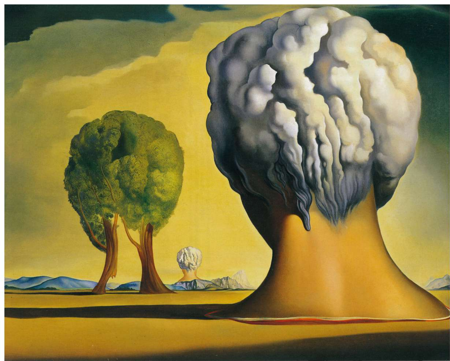
サルバドール・ダリ《ビキニの3つのスフィンクス》 1947年 公益財団法人諸橋近代美術館 © Salvador Dalí, Fundació Gala-Salvador Dalí, JASPER Tokyo, 2024 B0722