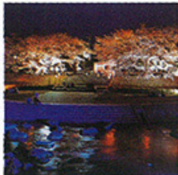
北須川・今出川沿いの桜並木