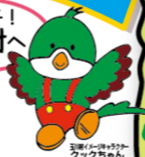
玉川イーグルクラブ クックちゃん