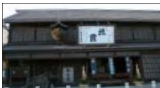
智恵子の生家・智恵子記念館

智恵子が実際に使っていた琴や蓄音機や光太郎と交わした書簡など智恵子に思いをはせる。周辺のほんとの広場、鎮魂の丘、愛の小道などをめぐり、短歌、俳句の創作などを行う。 お問い合わせ TEL:0243-22-6151