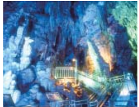
あぶくま洞 (レストランもあり) およそ8,000万年という歳月をかけて創られた大自然の造形美と神秘的な世界が続いている。近くにある天文台では太陽観測やプラネタリウム館での星座の物語も楽しめる。夏季のあぶくま洞広場斜面に広がる5万本のランタンも必見。開花に合わせて体験教室も開催。あぶくま洞管理事務所 TEL:0247-78-2125