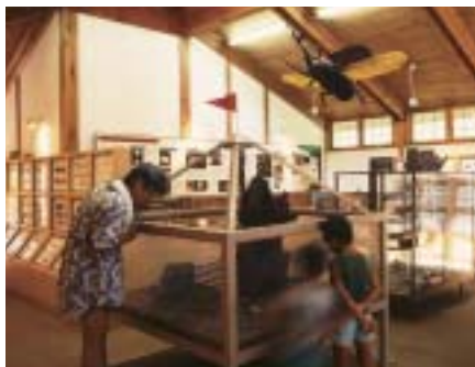
カブトムシ自然王国 自然の中でカブトムシの生態観察を家族で楽しめる。特に夏休みの体験スポットとしてお勧め。バーベキューハウスで栄養補給も。(株)田村市常葉振興公社 TEL:0247-77-4097