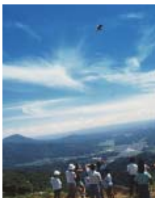
仙台平 星の村ふれあい館 (宿泊) ジェットバス付きの大浴場や和室、洋室の客室があり家族での利用もお勧め。地元の新鮮な食材による料理と低料金も魅力。TEL:0247-78-3100