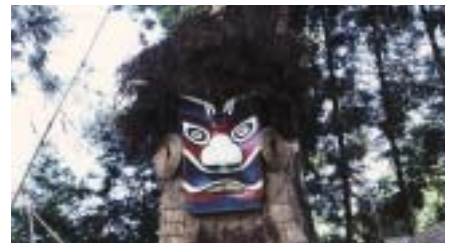
お人形様見学 身の丈4メートルの魔除けの神様で、3ヶ所にそれぞれ表情も色彩も違うお人形様を見学できます。毎年4月～5月に地元保存会による「衣替え」が行われるので、その後の見学が特にお勧め。田村市教育委員会生涯学習課 TEL:0247-68-3113