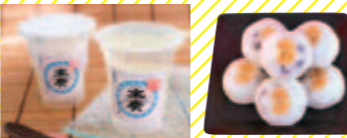
末廣酒ゼリー 末廣酒まんじゅう

酒蔵に直売店などが併設されている場合、現地では買えない限定酒や、お酒が苦手な人でも楽しめるスイーツなどのアレンジ商品が販売されていることも。酒蔵めぐりのおみやげにいかが？