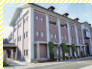
大七酒造 (二本松市)