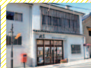
樽物屋酒店店 (二本松市)