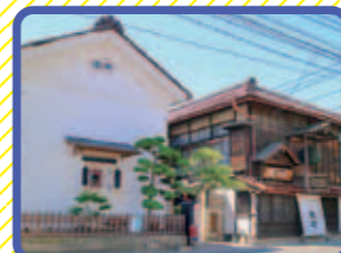
末廣酒造 嘉永蔵 (会津若松市)