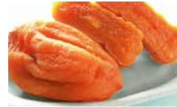
福島県産あんぽ柿(伊達地方) パック入店頭発表 福島県産あんぽ柿(伊達地方) 化粧箱入店頭発表

福島県の果物を贈り物にいかがですか。福島県の美味しい果物など、お土産も揃えてあります。