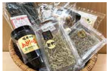
すしハネ 10枚×4袋 1,080円 小女子 70g 540円

自社工場で焼き上げた新のり、今が旬の新ワカメ、新青のり。相馬原釜で水揚げされた小女子としらす干しもおすすすめです。