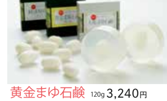
黄金まゆ石鹸 120g 3,240円 純まゆ石鹸 120g 2,160円 天蚕まゆ石鹸 120g 5,400円

希少な、屋外で飼育された天蚕まゆを丸ごと一個閉じ込め、シルクの良さがたっぷり詰まった石鹸です。