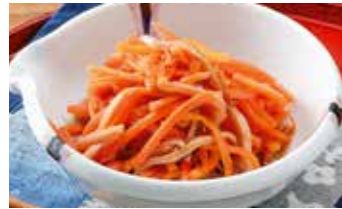
いか人参 黒胡麻ごぼう 170g 540円 250g 540円