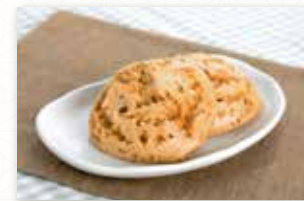
駒田屋本舗 福島市 みそぱん