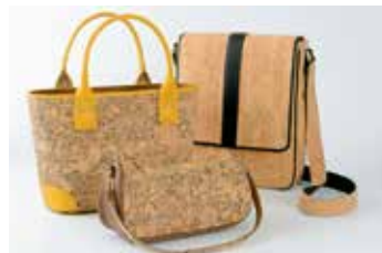
ショルダーバック 49,860円 トートバック 42,120円 ミニボストン 41,040円

コルクは地球が育んだ宇宙のおくりもの。軽くて水に強く、汚れても一拭きで綺麗になります。