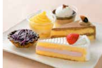
手作りオリジナルケーキ 各種108円