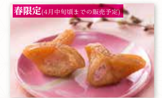
春限定(4月中旬頃までの販売予定)