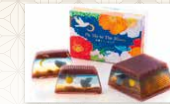
本家長門屋 会津若松市 羊羹ファンタジア

切る度に出てくる絵柄が変化し、三日月から満月へ羽ばたいていく羊羹です。愛を語るジャズナンバーは、名前で遊ぶ和菓子ならではの洒落心。シャンパンや鬼くるみ、レーズンなどを用いた大人な味わいで、紅茶やワインとも相性抜群です。