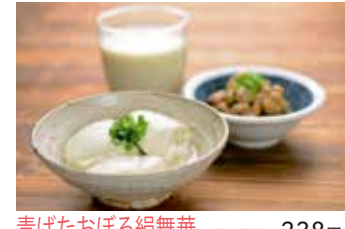
青ばたおぼろ絹舞華 1ヶ 200g 238円 塩で食べる納豆 410円 緑湯豆乳 500ml 680円

常に大豆の可能性を追求して、新しい食の提案と新商品の開発を通して「食は命なり、健康の源は大豆にあり!」と提唱してまいります。