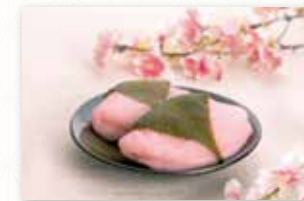
駒田屋本舗 福島市 桜餅