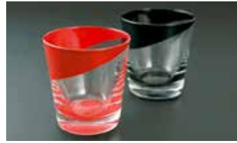
硝璃漆ぐい呑み 2,052円～ 硝璃漆ロックグラス 2,160円～

千藤オリジナルの硝璃漆や漆器、作家物の陶器や会津木綿・パッチワークなどの手作り品等を販売しております。