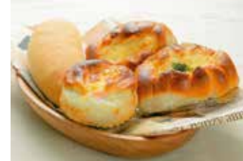
ラジウム玉子パン ちくわパン 210円 210円

創業からの味を大切に、地元の人に愛されているパン屋さんです。特に人気の、飯坂温泉名物ラジウム玉子を使ったラジウム玉子パンです。