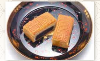
会津葵 会津若松市 かすてあん会津葵

東洋と西洋の文化が見事に融合した銘入りカステラ「かすてあん会津葵」は、コーヒー、紅茶、そして日本茶にも良く合うお菓子!! 1962年には科学技術庁長官の表彰を受けています。