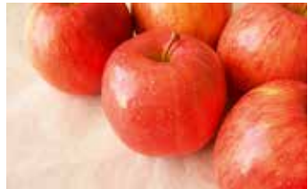
りんご・野菜 時価

農家6軒が集まったグループです。無農薬の栽培により、おいしい野菜、こだわり農産品素材を使ったジャムやドレッシング、一味ちがう果物等を販売します。