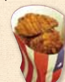
伊達鶏の から揚げ