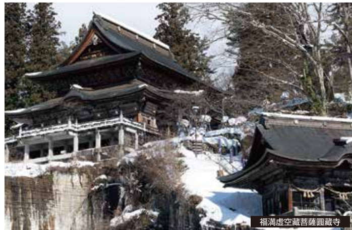
福満虚空蔵菩薩 圓蔵寺