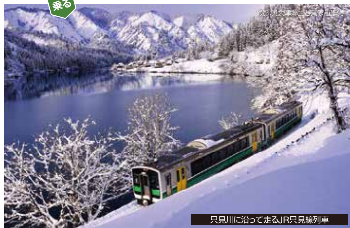
只見川に沿って走るJR只見線列車

※3月16日にJRのダイヤ改正があるため、時刻に変更が生じる可能性があります。掲載されている画像は全てイメージです。掲載されている内容は2023年12月25日現在のものです。予告なしに変更することがあります。