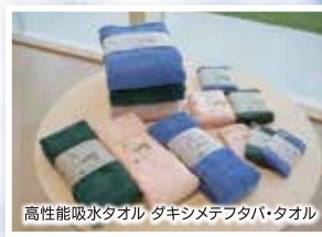
高性能吸水タオル グキシメフタバ・タオル