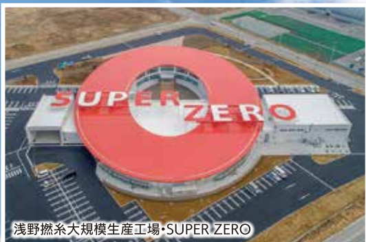
浅野燃糸大規模生産工場・SUPER ZERO

ホープツーリズムの学びの導入拠点。館内の映像や展示などの豊富な資料から、震災・福島第一原発事故直後から現在までの経過・復興のあゆみの全体像を学ぶことができます。世界でも類を見ない未曾有の複合災害の記録や記憶、復興の歩みを教訓として国内外に伝え、さらには将来へ引き継いでいくためにつくられた施設です。