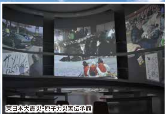
東日本大震災・原子力災害伝承館

福島第一原子力発電所の廃炉作業をご視察いただきます。ブルーデッキという高台から第一原発1~4号機などを間近で見ることができるほか、ALPS処理水について案内者から説明を受ける2時間20分のコースを予定しています。(廃炉資料館からの移動時間も含む)