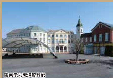
東京電力廃炉資料館