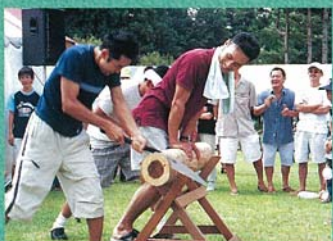
◎中島村いきいきフェスタ