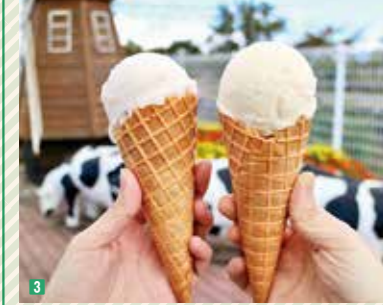
3 かがみいしジェラート