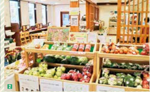
2 鏡石まちなかの駅 かんかてらす