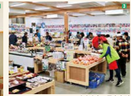
あだたらの里直売所