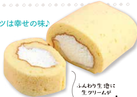
ふんわり生地にしクリームがたっぷり

JR東北本線 矢吹駅から車で約10分 Happy Berry TEL 0248-44-5538