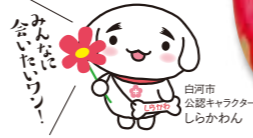
白河市公認キャラクター しらかわん