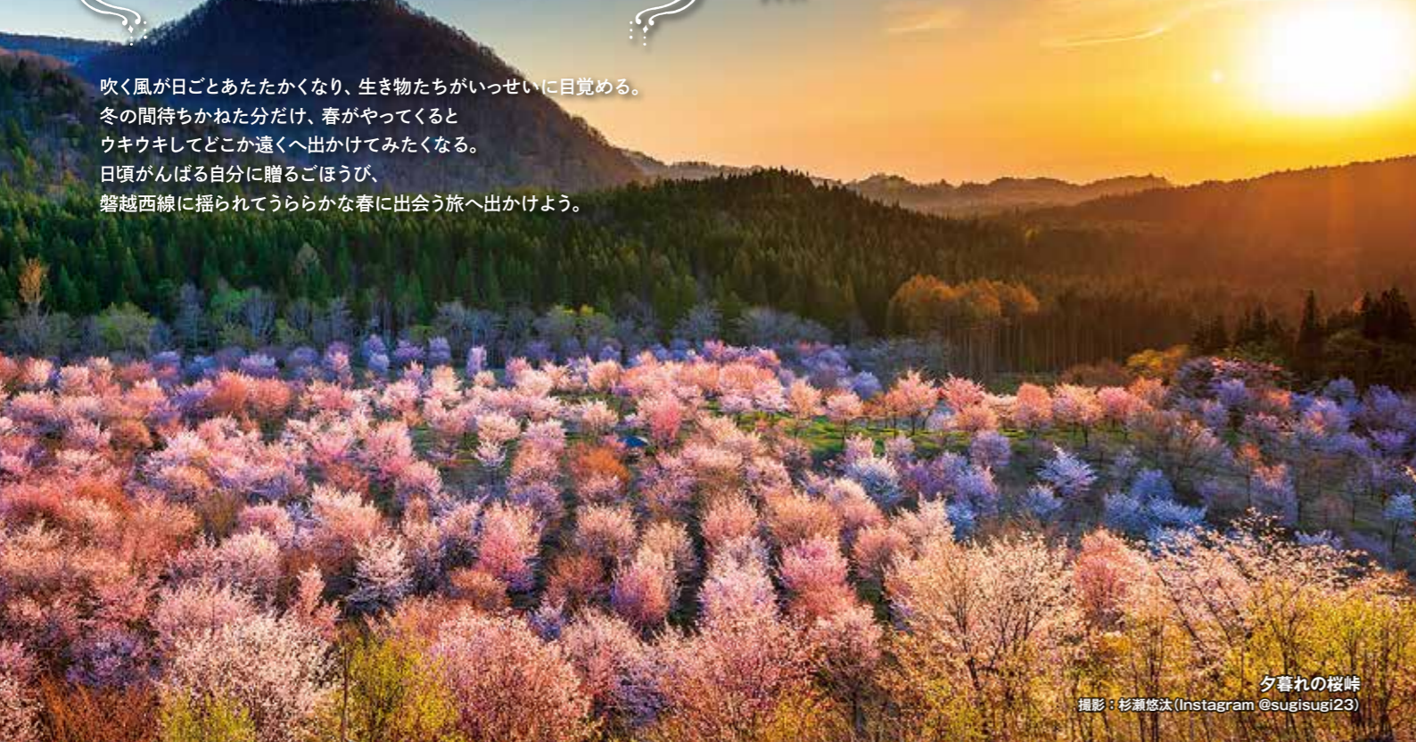
夕暮れの桜峠

吹く風が日ごとあたたかくなり、生き物たちがいっせいに目覚める。冬の間待ちかねた分だけ、春がやってくるとウキウキしてどこか遠くへ出かけてみたくなる。日頃がんばる自分に贈るごほうび、磐越西線で揺られてうらかな春に出会う旅へ出かけよう。