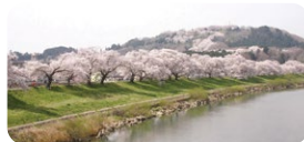
白石川堤一目千本桜

日本さくら名所100選の地である柴田町には、船岡城址公園や白石川堤などの桜の名所はもちろん、町内の至る所で桜を楽しめます。船岡城址公園内では、約2,200株の紫陽花が見事に咲き誇る「紫陽花まつり」や10万本を超える彼岸花が幻想的な「曼珠沙華まつり」が開催されるなど、年間を通して花を楽しむことができる美しい「花のまち」です。