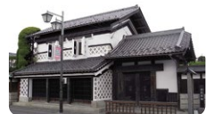
角田市郷土資料館

宮城県南部に位置する、山々に囲まれた穏やかな気候の角田市。「角田ブランド」として「米・豆・梅・夢・姫」の「角田の5つのめ」の魅力でブランドづくりに取り組んでいます。ロケットエンジンの研究開発を行うJAXA角田宇宙センターは日本のロケット開発の重要な施設となっており、豊かな歴史的資源と、宇宙を拓く夢の交差する場所です。