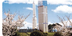
角田市スペースタワー・コスモハウス